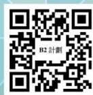
中醫藥應用調研及 研究資助計劃 (B2)