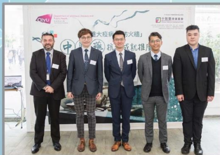
香港城市大學 「中醫藥與公共衛生：築牢重大疫病『防火牆』中醫藥抗疫成就推廣計劃」