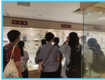
香港浸會大學 「中小學生中醫藥推廣計劃」