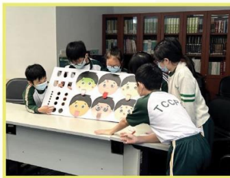
青松觀 「中醫藥小學與社區推廣計劃」