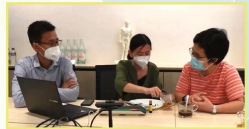
香港大學中醫全科學士(全日制)校友會 「專職醫療專業系列工作坊：言語治療」