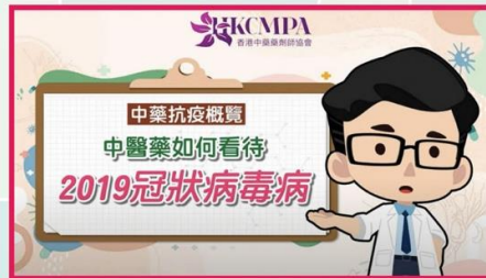
香港中藥劑師協會 「抗疫中藥宣教及藥學諮詢服務計劃」