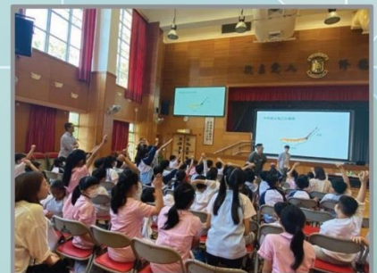
中華文化傳播基金 「網絡時空百草園2023/2024」