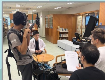
香港浸會大學 「從微電影推廣香港中醫行業」