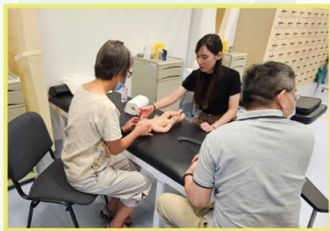
香港大學 「傳統中醫小兒推拿療法的專業培訓計劃」