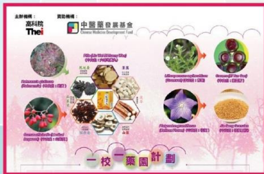
香港高等教育科技學院 「一校一藥園」