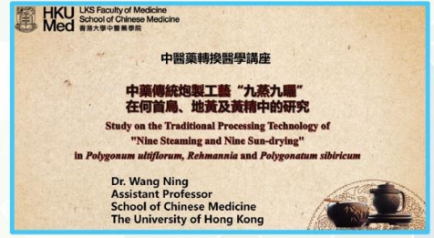
香港大學 「中藥炮製傳統工藝『九蒸九曬』的調研、優化及評價—以根莖類中藥何首烏、黃精及地黃為例」