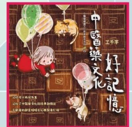
中華文化傳播基金 「中醫藥文化教育繪本圖書系列 (第二階段)」