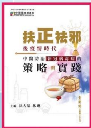
香港本草藥學會 「扶正祛邪—後疫情時代，中醫防治新冠病毒病的策略與實踐」