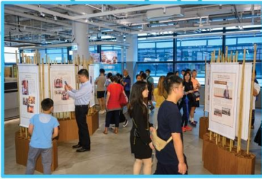
香港註冊中醫學會 「香港中醫藥文化保育與傳承」